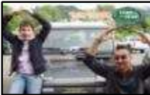
Antonio Carnino Defender 110 Ciriè (TO)

[Napoleonica-12] Come al solito gita stupenda, un giusto mix di affascinanti panorami e tecniche fuoristradistiche!!! Un grazie alla fantastica compagnia e ovviamente a voi 'Roberti' con il vostro staff organizzativo! Solo da voi affiancati ho la serenità e la fiducia di vivermi al meglio questa mia nuova attività!!!!